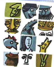
FOIRE DE SAINT-OURS AOSTE 30-31 JANVIER 2011

24 BIMBI OVERSIZE Tuo figlio mangia troppo e sei preoccupata? Un nuovo programma tv insegna a evitare l'obesità. Per partecipare chiama lo 02-36564957 o scrivi a candidature@magnolatv.it